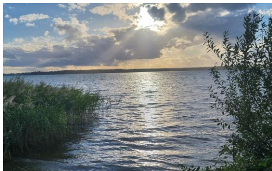
Blick auf unseren Hausstrand/ Plauer See

Jedes Jahr zur Herbstzeit ereignet sich in den Flachwassergebieten Mecklenburgs und Vorpommerns ein ganz besonderes, beeindruckendes Naturschauspiel: Tausende Kraniche legen hier einen Zwischenstopp auf dem Weg gen Süden ein, um zu rasten und frische Kraft für den Aufbruch zu neuen Ufern zu sammeln. Mitten in der malerischen Seenlandschaft Mecklenburg-Vorpommerns liegt das Naturschutzgebiet der „Langenhägener Seewiesen“, ein solcher Kranichrastplatz. Während der Zeit des Vogelzugs können hier die eleganten, wunderschönen „Vögel des Glücks“ über mehrere Wochen hinweg beobachtet werden.